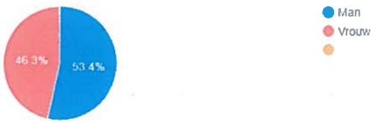
Verdeling van het aantal medewerkers per geslacht

De algemene verdeling tussen mannelijke en vrouwelijke medewerkers is evenwichtig en bedroeg respectievelijk 53,4% en 46,3%.